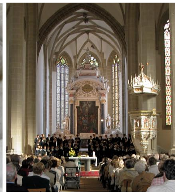
In der Stadtkirche St. Marien können Sie den Grabstein Katharina von Boras und das Cranachwerk „Die vierzehn Nothelfer“ betrachten. Die Tradition des Kantors der Reformation Johann Walter wird auch heute noch in Torgau durch anspruchsvolle Kirchenmusik gepflegt.