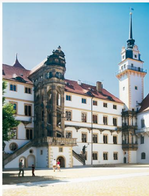
Erleben Sie im Großen Wendelstein auf Schloss Hartenfels einen überwältigenden Raumeindruck meisterhafter deutscher Baukunst der Frührenaissance.