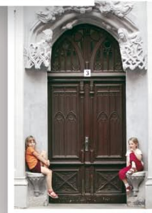
Im Torgau-Informations-Center direkt am Marktplatz, im historischen Renaissance-Rathaus finden Sie neben Informationen so manche Erfrischung und Spezialität.