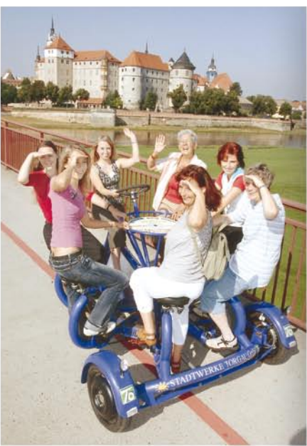
Entdecken Sie den Glanz der ehemaligen kursächsischen Residenz bei einem Bummel durch Torgau - die Renaissancestadt.