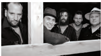
Big Joe Blues Band